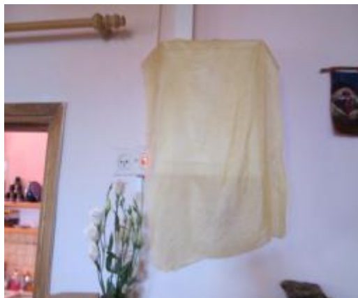
תמונה 2 : אולם הגן